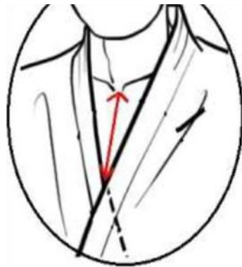
図 2 拡大