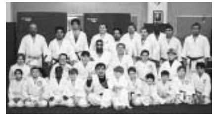
夜間の練習会(タコマのYMCA道場にて)

この交流事業が目的としているのは単なる柔道交流ではありません。ホームステイをすることによって、民情に触れ、異文化を理解する力をつけること、そして