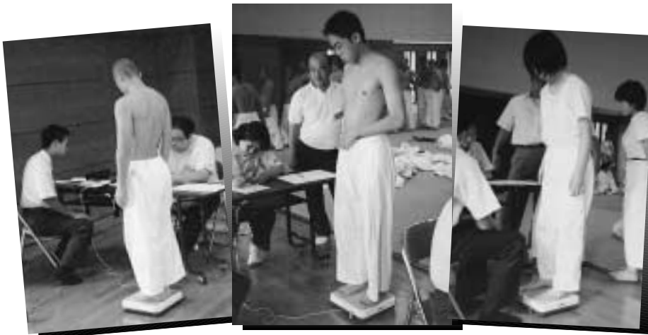
「計量OK、やっと安心して食事できるね」 全国中学校柔道大会（福井県）より