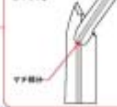
肩パット サイドパッド