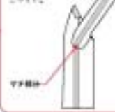
薄手の肩パット サイドパッド