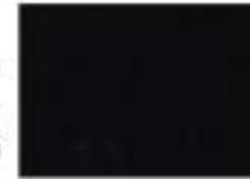
【冬用・合服用：パンツ用】

高級感に富んだウール素材。カシミアによる光沢のある質感とドレープ感が上質感を演出しています。 細縫子の糸を使用した縫製で、縫製で縫製が良く、とても滑らか。ナチュラルストレッチによる伸縮性があり、スポーツジャケットに嬉しい動きやすさと抜群の着心地の良さが特徴です。